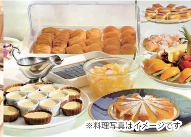
※料理写真はイメージです